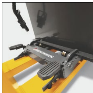
Sistema professionale di gestione batteria